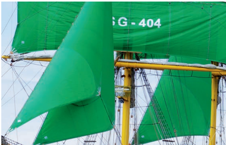
Die Alexander von Humboldt II fährt wieder mit grünen Segeln.

Mit dem Besuch des Partnerschiffs der Wissenschaftsstadt, „Alexander von Humboldt II“, wird das Konzept erneut aufgegriffen. Auch die „Lübecker Schiffe“ vor Ort machen mit.